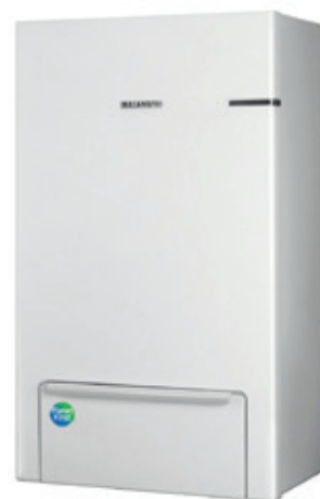
Vnitřní Nástěnná Hydro Jednotka

Pro prostorové vytápění a ohřev TUV s externím zásobníkem je možné zvolit variantu s vnitřní nástěnnou hydro jednotkou. Vnitřní nástěnná hydro jednotka je vybavena veškerými hydraulickými komponenty a vývody na otopnou soustavu.