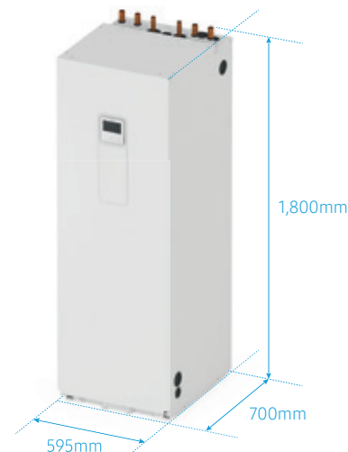
Kompaktní Rozměry ClimateHub